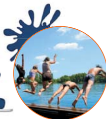
Un viaggio da urlo!