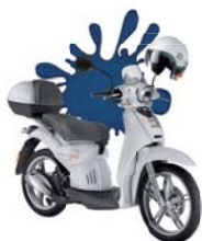
Scarabeo Net con casco