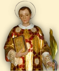
Museo di San Lorenzo