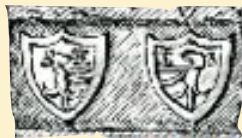
Museo della Valle