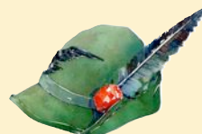
Museo del Soldato